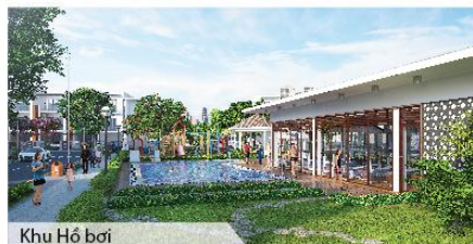
Khu Hồ bơi