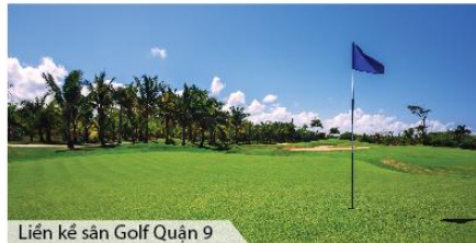
Liên kề sân Golf Quận 9