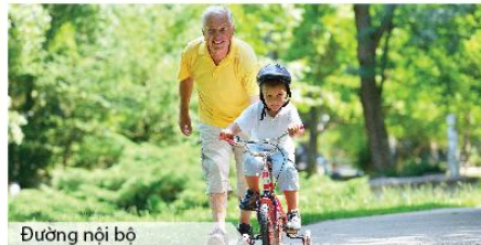
Đường nội bộ