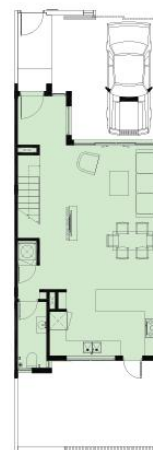
MẶT BẰNG TẦNG 1