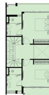
MẶT BẰNG TẦNG 3