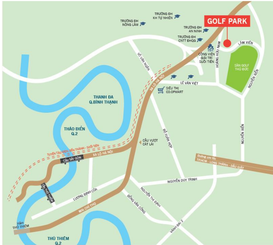
BẢN ĐỒ VỊ TRÍ DỰ ÁN: MẶT TIỀN SÂN GOLF VIỆT NAM, P. LONG THẠNH MỸ, QUẬN 9, TP. HCM

Để biết thêm thông tin chi tiết, xin Quý khách vui lòng liên hệ Chuyên viên kinh doanh: