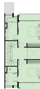
MẶT BẰNG TẦNG 2