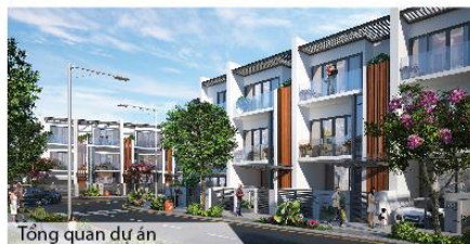
Tổng quan dự án